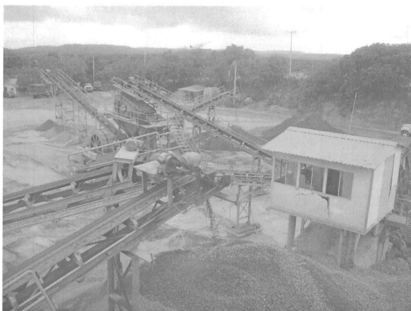
Planta de Beneficio-PAVIMENTO UNIVERSAL S.A.