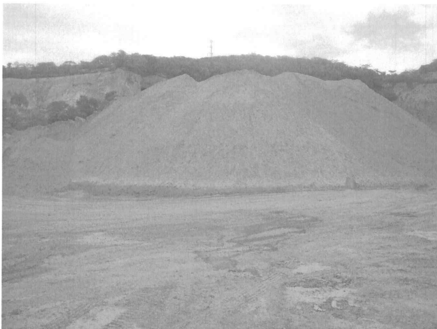
Conos de material de construcción almacenado a granel y a cielo abierto sin cubrimiento

“POR MEDIO DE LA CUAL SE OTORGA UN PERMISO DE EMISIONES ATMOSFERICAS A LA EMPRESA PAVIMENTO UNIVERSAL S.A Y SE TOMAN OTRAS DETERMINACIONES.”